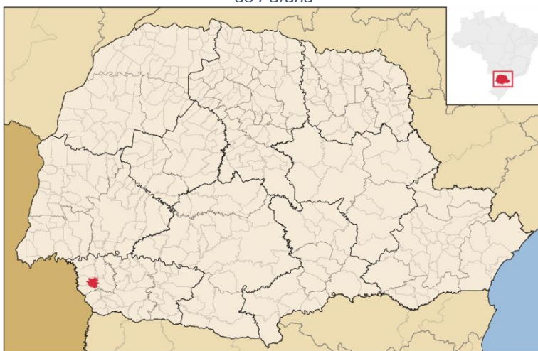
Figura 1 - Localização do Município de Bela Vista da Caroba no Estado do Paraná