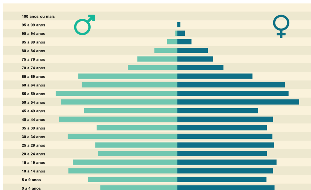
Figura 3 - Pirâmide Etária do Município de Bela Vista da Caroba

envelhecimento da população, que em poucos anos, terá uma população majoritariamente idosa.