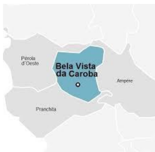
Figura 2 - Municípios que fazem limite com Bela Vista da Caroba

O município possui uma extensão territorial que abrange uma área de 148,052 Km 2 , entre as coordenadas geográficas extremas de 53° 39' 58"W de longitude e 25 ° 52' 46"S de latitude, com altitude média de 543 metros, sendo que a sede do município está localizada à 553,8 metros de distância da Capital do Estado do Paraná - Curitiba. Seus limites territoriais encontram-se com os municípios de Pérola D'Oeste, Ampére e Pranchita (IPARDES, 2025).